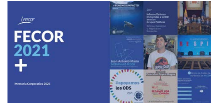
Memoria FECOR 2021