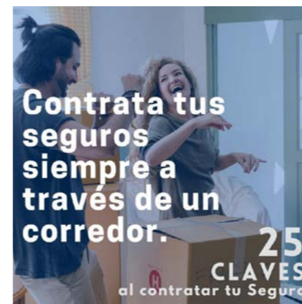
Campaña 25 claves al consumidor