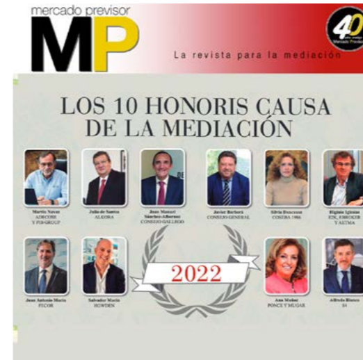
Mercado Previsor Los 10 Honoris Causa de la Mediación Enero 2022